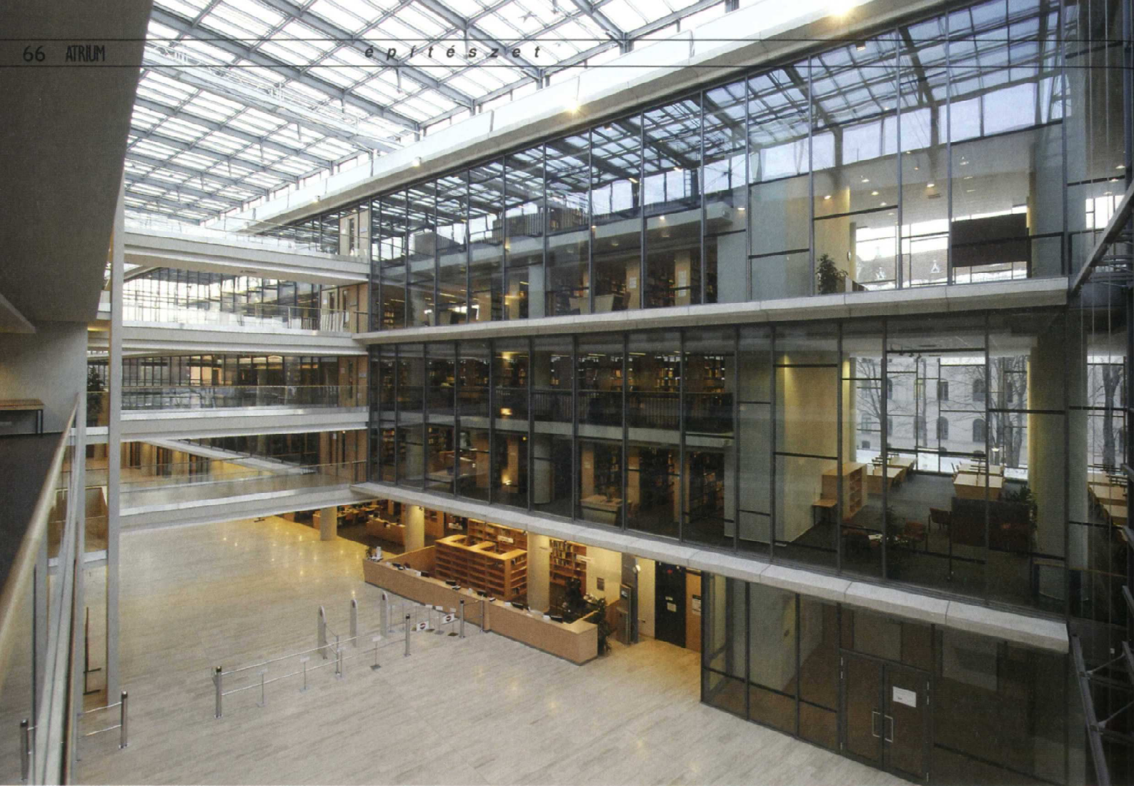
A két épületszárnyal létrehozott belső üvegezett udvar a világítást igénylő terek, így a tanulóhelyiségek és a szabadpolcos könyvtár számára biztosít elegendő fényt