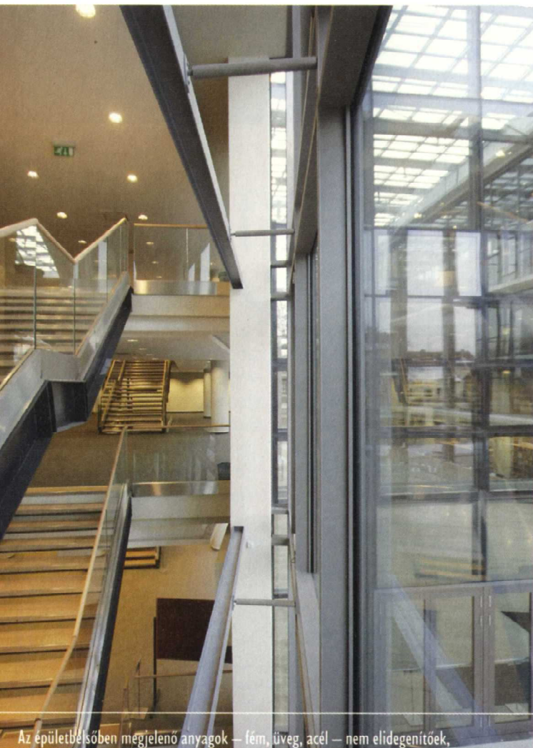
Az épületbelsőben megjelenő anyagok – fém, üveg, acél – nem elidegenítők,

A helyszín Szegeden az Ady téren, a XIX. század végén romantikus stílusban épült egyetemi épület szomszédságában található. A szerzőpáros az alapkoncepciót, akár egy kiáltványt, így fogalmazta meg: „Az épület térbeli elrendezése legyen áttekinthető, tömör. A szabadpolcos olvasói terek a meglévő egyetemi épület felőli kedvező tájolású parkra nézzenek. Az épület hossz tengelye mentén legyen átlátható. Tömör térfalat adó funkció ne kerüljön a középső traktusba, csak előkert, előcsarnok, vertikális közlekedők, hidak és belső udvar. Ez a nagy belmagasságú térsor képezze az épület belső tengelyét”.