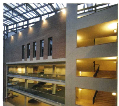
Az udvar légrerét a két tömböt összekötő és a közlekedést biztosító négy híd szeli át

Ez az oldal zaj-, hőtermelési és környezeti szempontból is egyaránt a legmostohább, ezért ebbe az irányba az épület téglahomlokzata – az üvegezettel ellentétben – kifejezetten zárt.