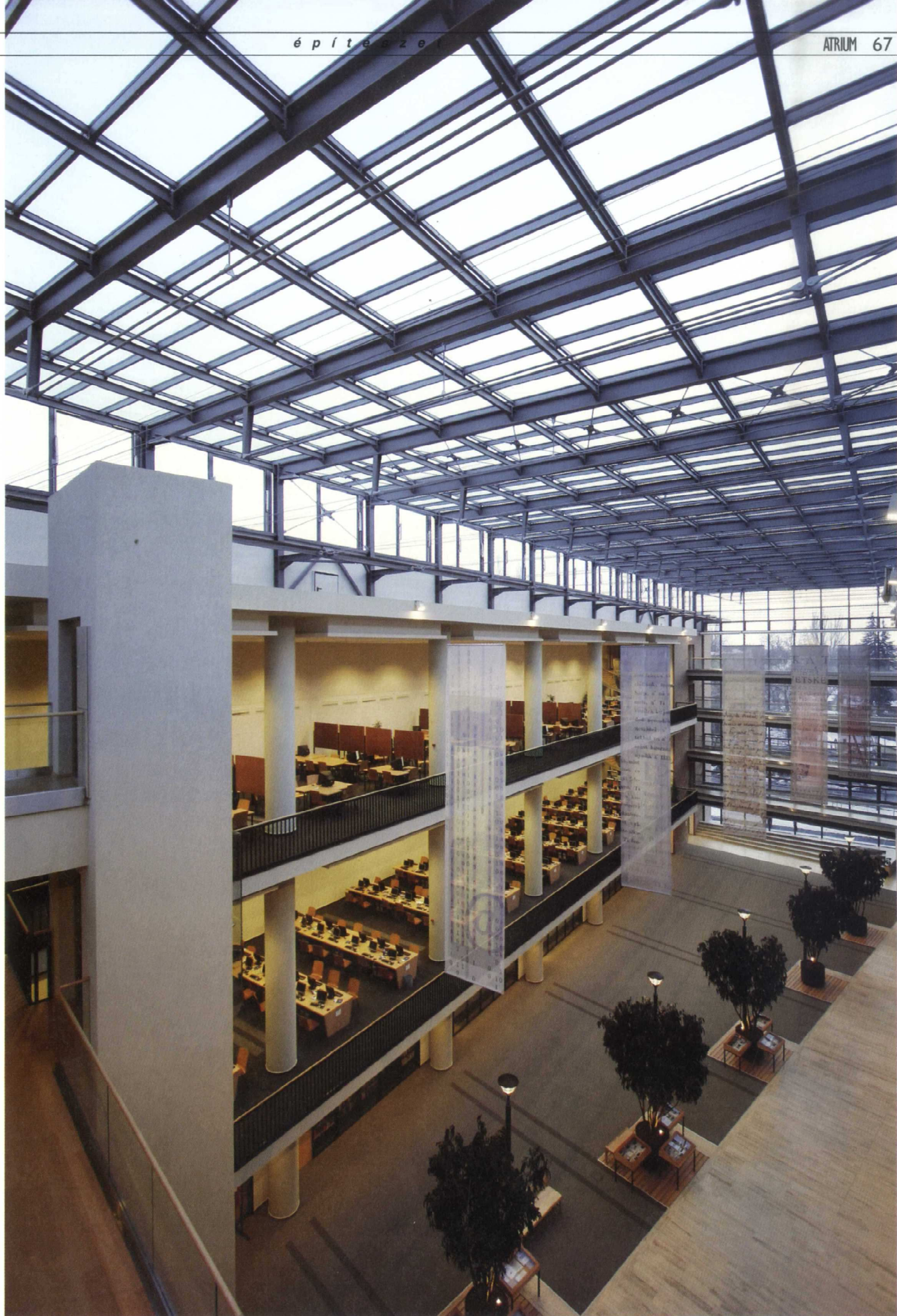
Az udvar burkolatváltásában megjelenő szögtrés — az újat a régivel összekapcsolva — a már meglévő egyetemi épület tengelyének irányát mutatja