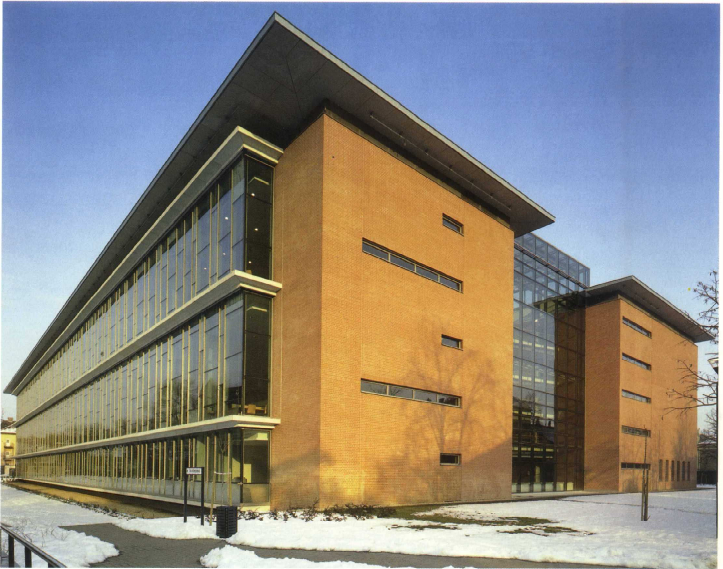
Jól elkülönülnek egymástól a tömör és a transzparens felületek. Az épület Zászló utcai sávjában a tömör homlokzatok mögött helyezkednek el a gépészeti és kiszolgálóterek, a raktárak, valamint a homlokzatból szegmensíves konzollal kinyúló konferenciaterem