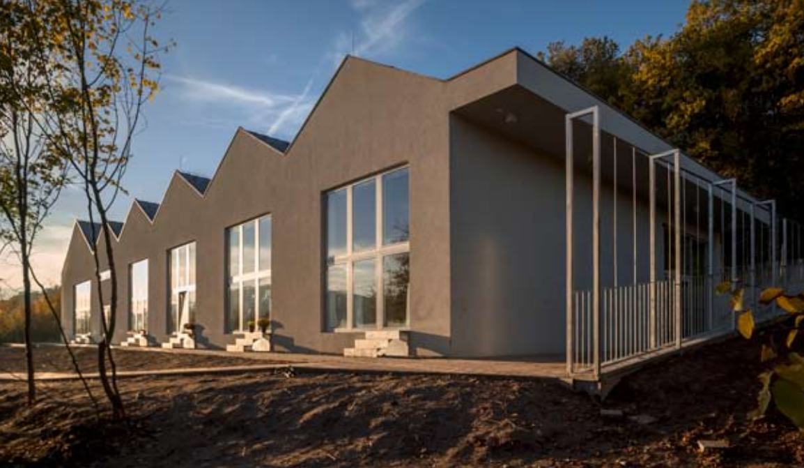
Minden osztályterem hatalmas ablakokat, valamint az udvarra nyíló, önálló kijáratot kapott