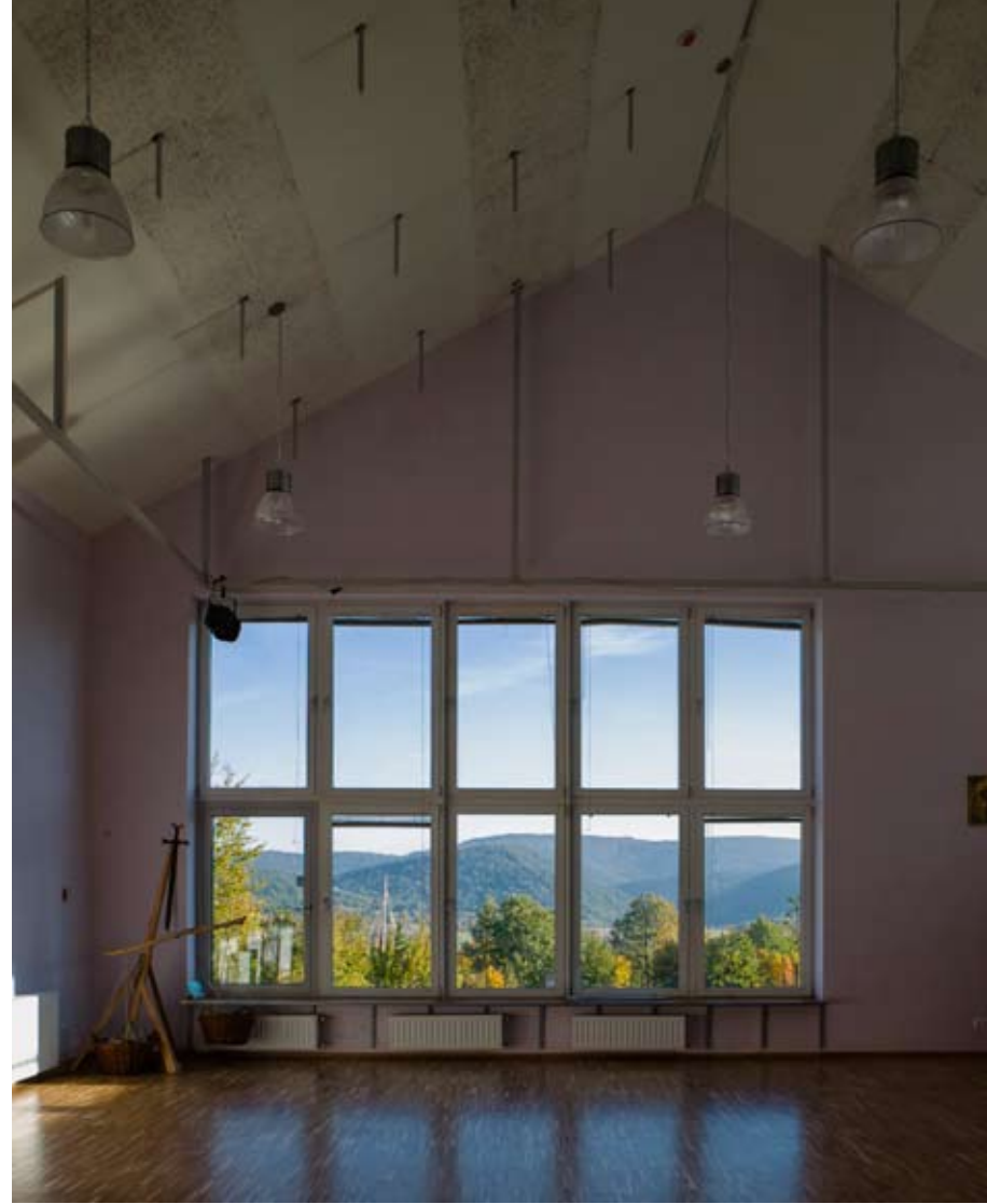
Hatalmas ablakkal tekint a Pilisre az euritmia-színházterem

Az első, amit építeni kellene, egy euritmia-színházterem. Eszembe jut a németországi öreg Waldorf-tanár, aki azt mondta: „Ha Waldorf-iskolát építesz, legelőször a színháztermet építsd fel. Ez a legfontosabb, ez az iskola szíve; a többit majd ahogy lehet; az osztályok addig működjenek a terem egy-egy sarkában...” És kell hozzá még négy tanterem (ami egyszer majd műhellyé is alakítható).