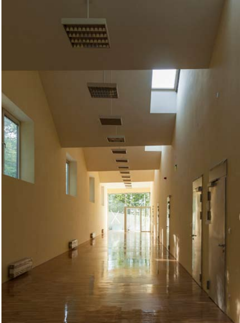
Tágas, nyílegyenes folyosóról nyílnak az osztálytermek