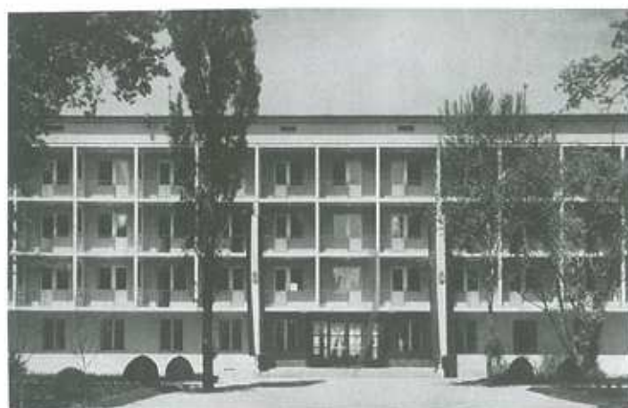
HIDAS LÁJOS: MARI ÜDÜLŐSZÁLLÓ (1938) – TÉR ÉS FORMA 1938/7.