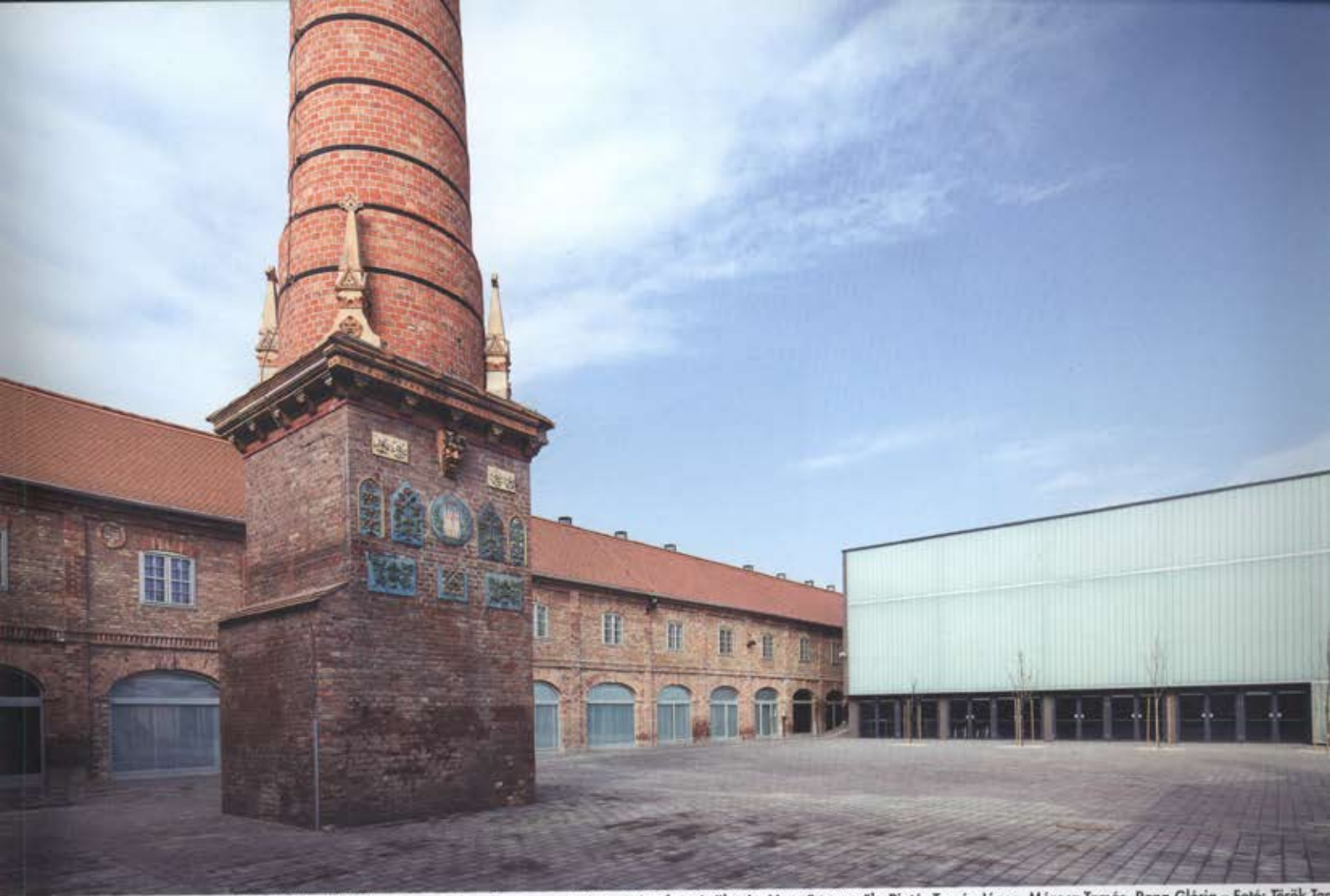
A Pécsi Kulturális Központ, vagyis az úgynevezett Pirogránit udvar épületei – Vezető tervezők: Pintér Tamás János, Mórocz Tamás, Papp Glória