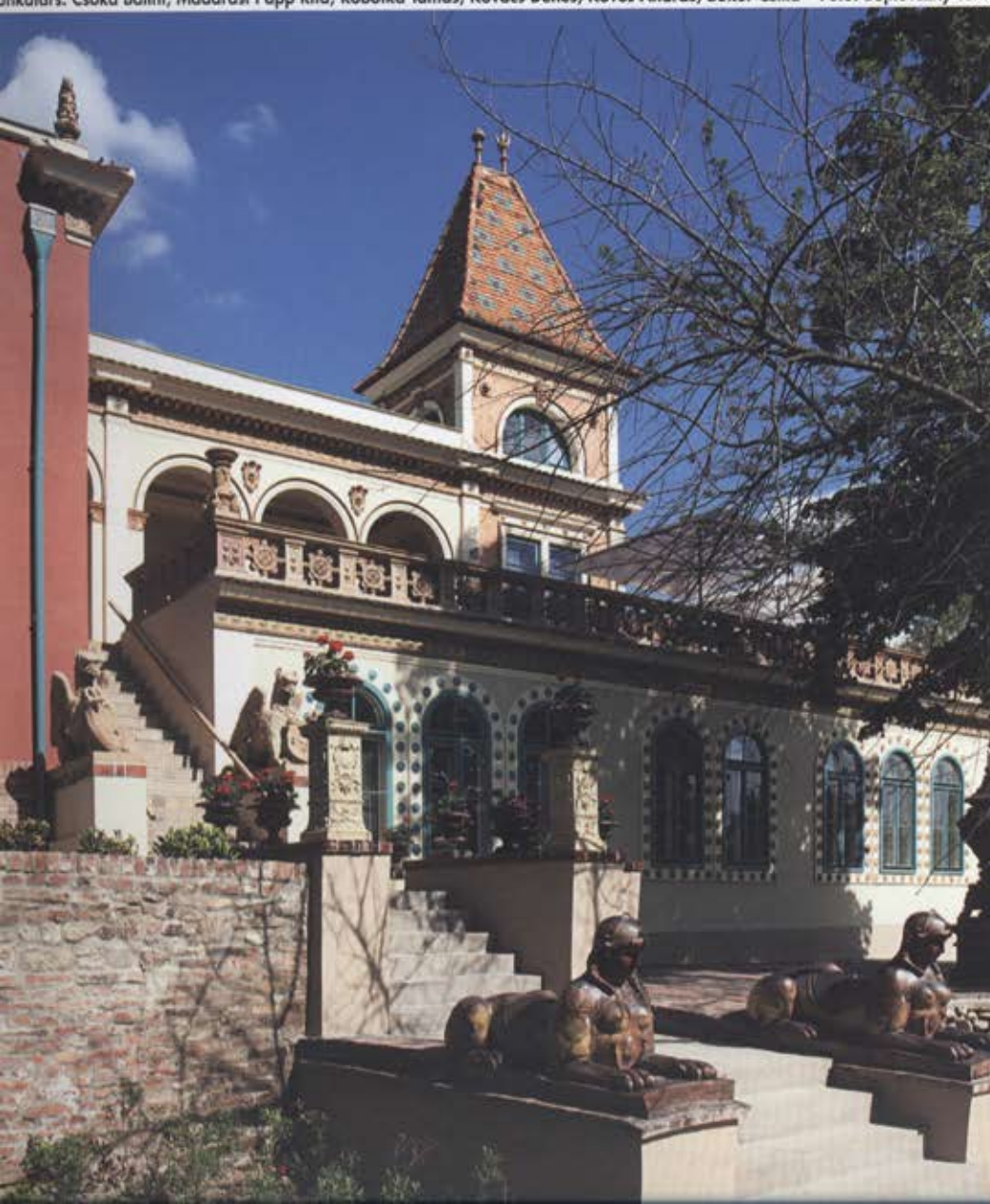
zin étterem, Borozó, Gyártörténelmi kiállítás – Építész tervező: Csaba Kata, Rádószy (f) László, funkatárs: Csóka Bólint, Madarasi Papp Rita, Robotka Tamás, Kovács Dénes, Köves András, Bakor Csilla – Fotó: Bujnovszky Tamás

és Gyerek Negyed, Egyetemi Negyed belső arányain, térkapcsolatain és ritmikáján dől el minden. Egy önmagával határos struktúra jött létre, ami éppen elég nagy és heterogén ahhoz, hogy változatos és organikus szerveződő egészévé álljon össze. Fontos újra rámutatni a műfaji, funkcionális és tervezői sokszínűségeire. Ez a szerves szerveződés alapja. Olyan ez, mint a biodiverzitás elve, ami a fenntartható és fennmaradó (öko)szisztémát a nagyfokú változatossághoz rendeli hozzá. Minél több fajból adódik össze egy rendszer, annál működőképesebb is.