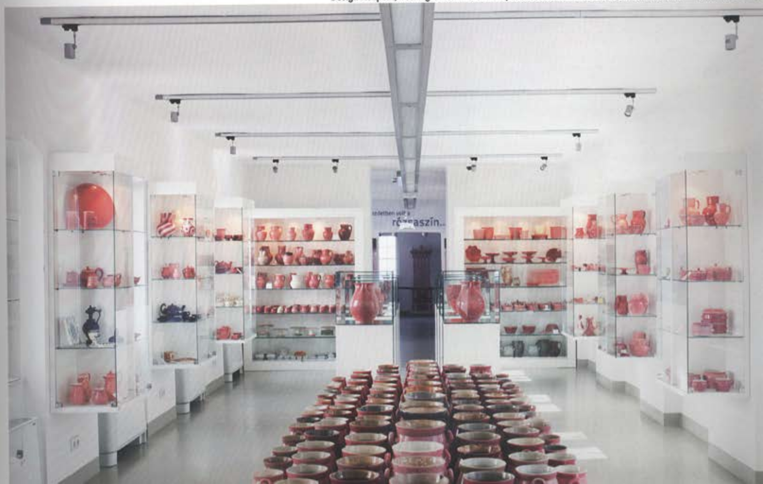
Design Központ, Vendégház kiállítótere – Építész tervező: Helfrich Gábor, Konrád Péter – Fotó: Bujnovszky Tamás

Végezetül egy talán érdekes megfigyelés. Ha délről, tulajdonképpen topográfiaailag „alulról” érkezünk, akkor a finoman emelkedő bejárati útvonal minden sarkán, átjárójában új és új építészeti részletet, épületet fedezhetünk fel, az egész talán nem látható át, míg a részletek dominálnak. Fölérve a díszes műemléki épületekhez, visszanezve a negyedre, különös tetőtájba simuló képpé áll össze a nagy egész, amiket az ég felé nyújtózó téglakémények ritmizálnak. Karcsú, a réteges egészből kitörő nyalábok ezek, amelyek az égi szféra felé mutatnak, kapcsolatot keresnek földi és égi között. Utunk végén nemcsak időben, formában, látványban és minőségben érkezünk tehát, hanem valami derengő, elemelt, misztikus nagy történeti részeseivé is válunk.