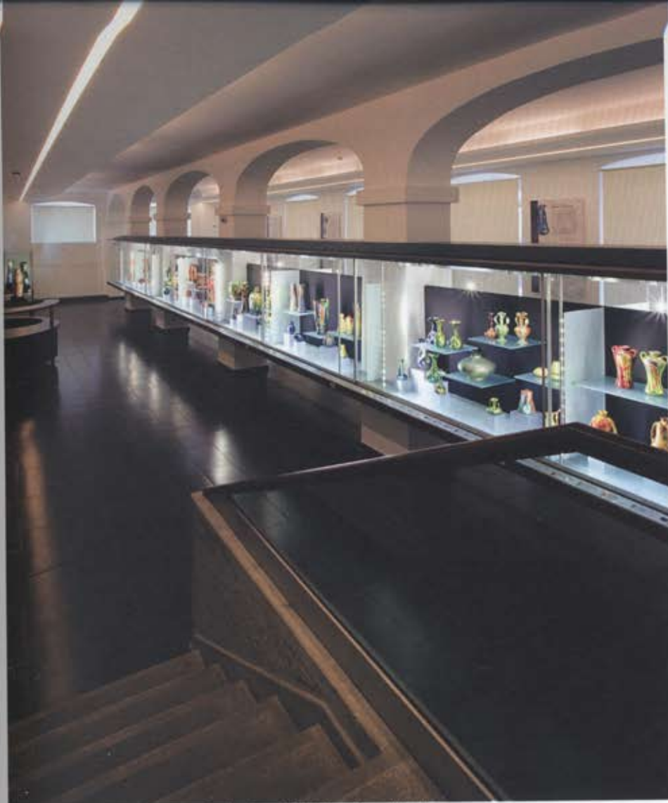
A Sikorski-ház kiállítóterében kapott helyet Gyugyi László magángyűjteménye – Építész tervező: Laczó Zoltán, építész munkatárs: Barna Balázs, Pálóczi Tibor – Fotó: Bujnovszky Tamás

kötő hidat, az ún. Pirogránit Udvar, de a képtár finoman süllyesztett épületét is. Különféle időbeli, formai rétegek, csúcspontok és halkabb, csöndesebb részletek mellett külön kiemelném az épületegység nagyszerű belsőépítészetét, ami az épületdramaturgia szempontjából távolról sem játszik alárendelt szerepet, hanem teljes értékű réteggént van jelen.