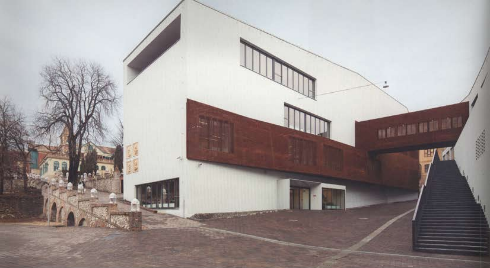
Művészeti Intézet, Doktori iskola, Kerámia Tanszék épületei a jellegzetes rozsdás kapcsolattal – Építész tervező: Pethő László (GEON Építéstudió Kft.)

Prózaian szólva egy ipari, technológiai innovációról beszélhetünk, ami újra felfedezi, mindazonáltal korszerűsíti elődei eljárását. Így teremt egyedi, világraszóló hírnevet világszerte keresett, csodálatos termékeinek. Ennek az újrafelfedezésnek, a technológiai és fizikai attribútumok analízisén alapuló megértésének történetünk szempontjából is kulcsszerepe van. Úgy érzem, mintha az innováció és tradíció egyensúlyának felbomlása, illetve a mesterségbeli tudás elvesztése vezetett volna ahhoz is, hogy a Zsolnay Gyár nem élte túl az államszocializmus és a vadkapitalizmus évtizedeit. Szomorú példa jut eszembe. Talán Káli Béla mesélte, hogy amikor a Grescham-palota rekonstrukciója zajlott, ijedten konstataáltak, hogy a gyárban már nem ismerik azokat a recepteket, ami alapján az eredeti századfordulós kerámiadiszekeket újra lehet gyártatni. Egészen Ausztriáig, egykor a Zsolnayban dolgozó, régóta önállósdott és kivándorolt mérnök műhelyéig kellett menniük, hogy megfelelő gyártót találjanak. Idehaza elveszett, leépült az a szellemi, érzelmi közeg, amiben a mesterség értékei valóban értékek, valóban megtartandóak. A mostani rehabilitációs program egyik legfontosabb találmánya, hogy heterogén, pezsgő, szárnyaló kulturális közeget épít elsősorban. Azzal a céllal teszi mindezt, hogy ez a közeg a jövőben képessé váljék új, inspiratív energiák felszabadítására, ami