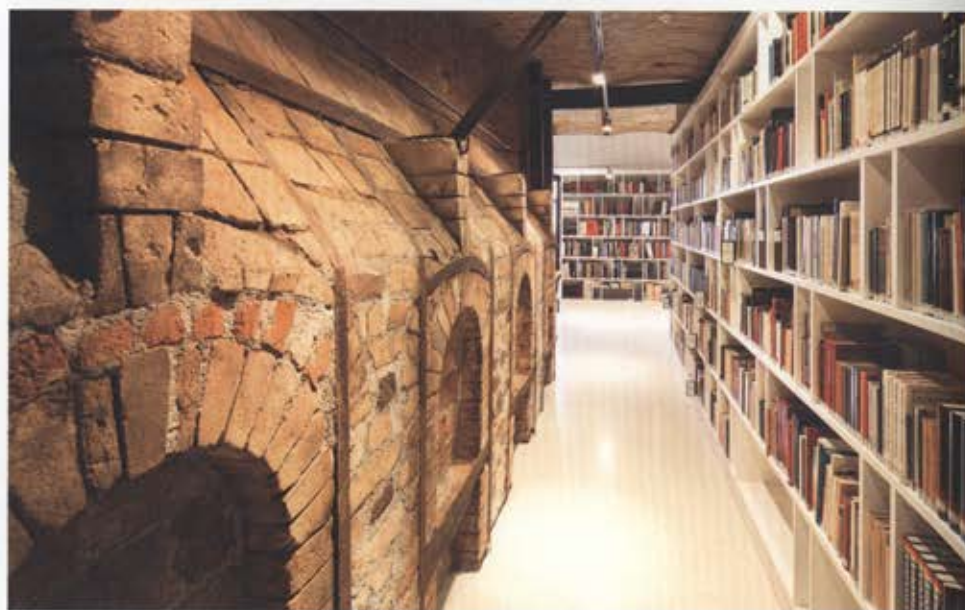
Részletek a Vizuális Művészetek Intézet, illetve a könyvtár belső tereiből –

Vezető tervező: Herczeg László, építészek: Weichinger Mónika, Borsos Melinda – Fotó: Török Tamás