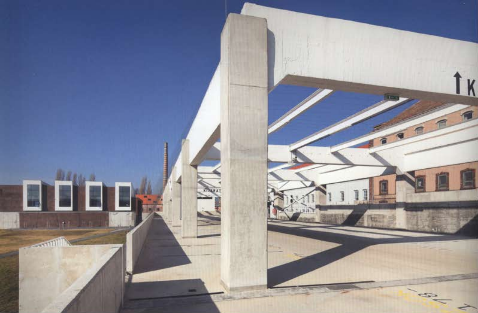
...ben Herczeg László parkolójának fehér szerkezete. Háttérben ...osztat Tanszék – Építész tervező: Somogyi Tamás, Tóth Tamás Török Tamás