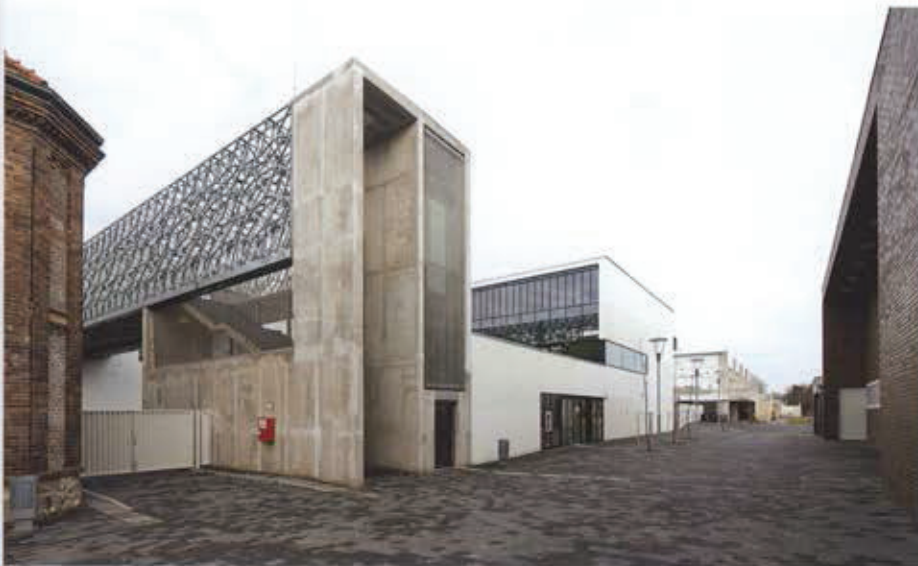
A hid és a menza új épülete (E01)

tekintetében nem áll rosszul, a jelen eredményei azonban még elmaradnak a múlttól. Léptékéből adódóan a beruházás akkor válhat életképesé, ha a negyed képes túlnőni regionális szerepén, és ezzel az ország egyik jelentős decentrumává válhat.