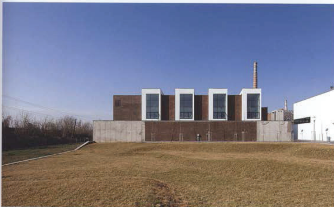
A Szobrász Tanszék a déli kert felől (E34, 74)

Ugyanakkor kezdetől fogva érezhető volt egyfajta józan magatartás, amely megpróbál belebújni az adottságokba, és a maga természetességével alakítja a negyedet. A szándékot jól kommunikálta a sajátos tervpályázati grafika, ami a Tesz-vesz város című könyv hangulatát idézve koherens képet alakított ki az additív beavatkozási formáról. Szerencsés döntésnek bizonyult továbbá,