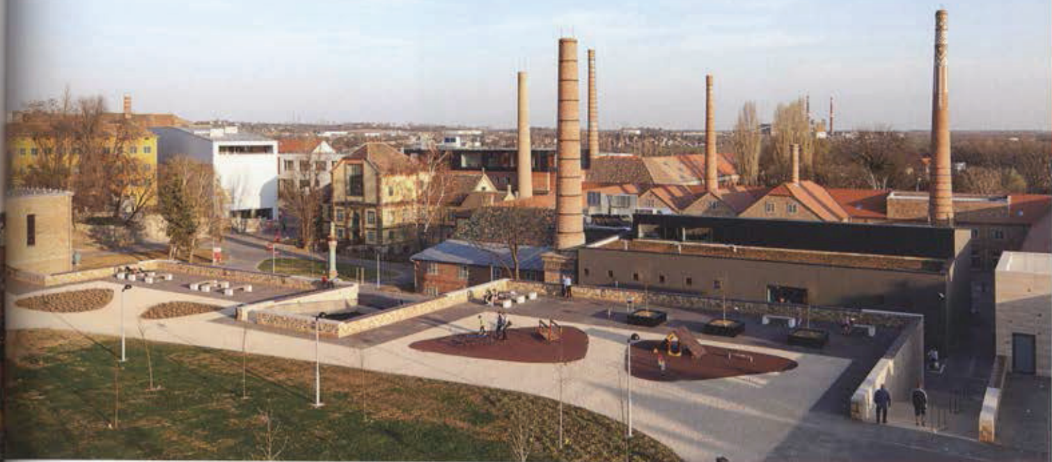
A negyed a Bábszínház felől