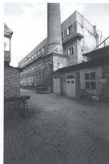
Ilyen volt és ilyen lett, Médiakommunikáció Tanszék, E25-ös épület