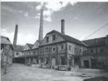
Ilyen volt és ilyen lett az Alkotó negyed

Akárhogy is alakul a belváros és a negyed sorsa, a városépítészeti eszközöket csak az előre lefektetett funkcionális program fényében szabad értékelni. Az EKF projektet megelőzően születtek már elképzelések a terület hasznosítására, ezek azonban merevebben kezelték a negyedet, a helytörténeti jelentőségű elemek hangsúlyozásával az egykori üzemet skanzenként alakították volna ki. Szerencsére a programalkotást megelőző konferenciák, civil kezdeményezések és a hazájából jó előképekkel érkező holland tanácsadó szerepvállalása elősegítette,