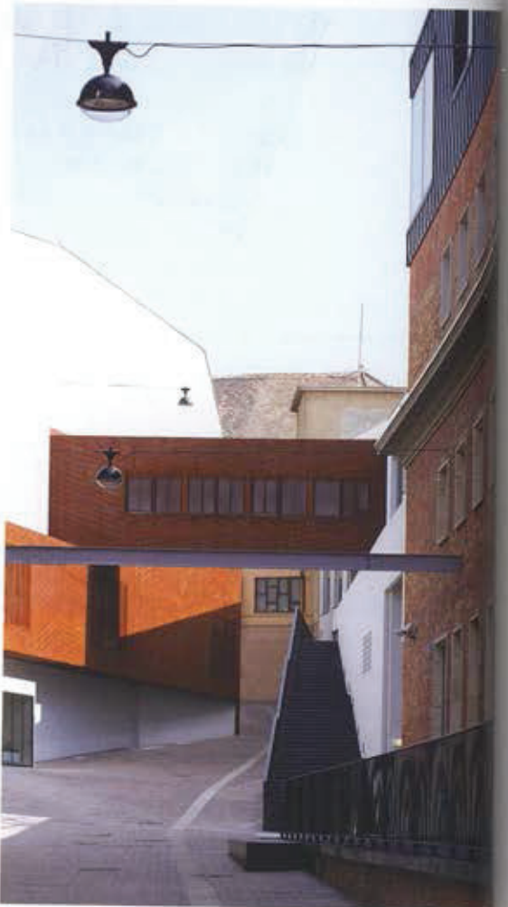
Ilyen volt és ilyen lett: jobb szélén a médiaépület, a híd balján a zenekola, jobb végénél pedig a doktori iskola, E25, E2, 22-es épületek