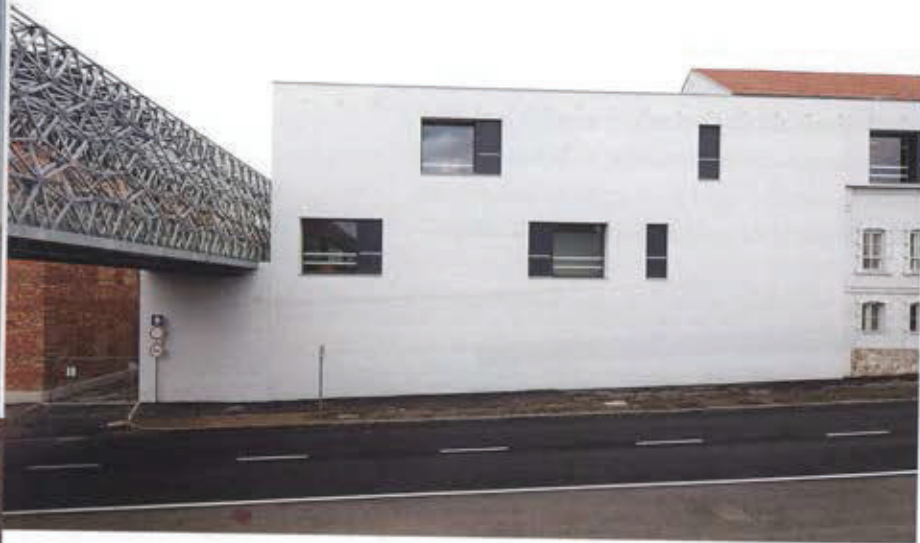
A doktori iskola épülete a 6-os út felől; jobbra Budapest