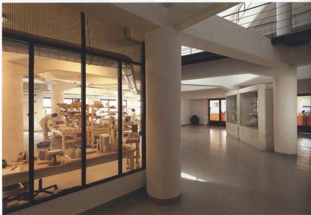
Látványmanufaktúra egybenyitott közönségterei, E18-as épület

azt, hogy bárhol tornyokat kellett volna építeni, de abban is biztos vagyok, hogy a szobrász műtermek shédátiratai közelebb érnek a hely égkontúrjához, mint egy alacsony hajlásszögű tető.