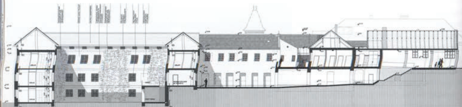
Hosszmetszet a Míves negyed udvarain át, az épületegyüttes az udvarokon át is bejárható