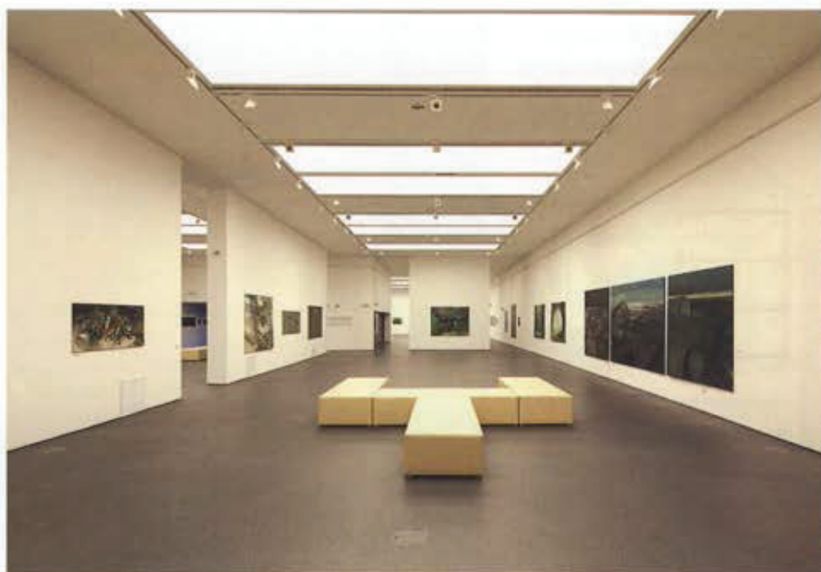
A Pécsi Galéria föld alatti kiállítótere, E31-es épület