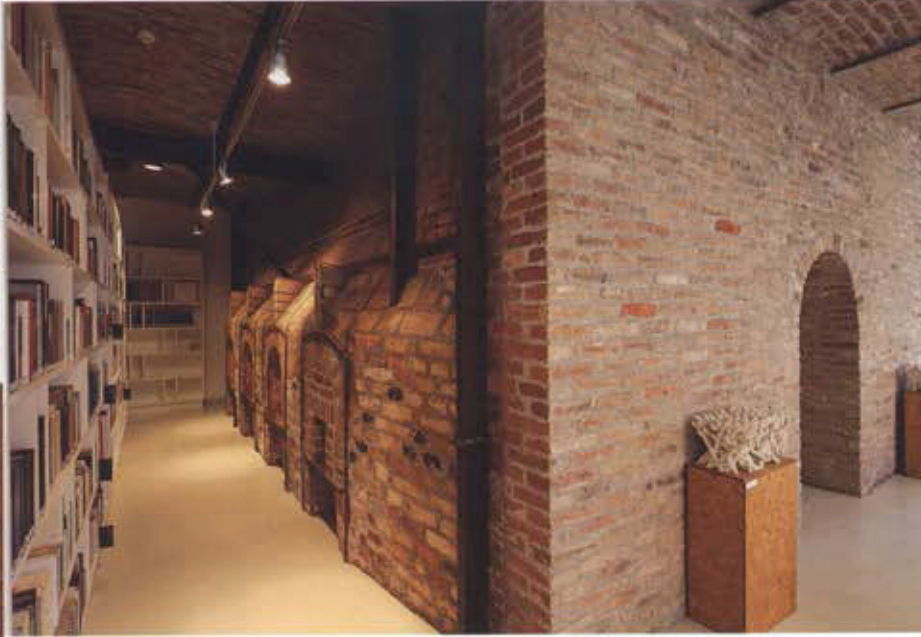
A könyvtárépület kemencéi, amelyekben médialaborokat, olvasótermeket hoztak létre, E32-33 épület

rántsem végleges – történet újabb fejezetének tekintették a jelenlegi átalakítást, fel sem merült bennük, hogy bármit is véglegesítsenek, netán „megoldjanak”. Úgy tűnt számukra, hogy a legtöbb pályázó nem volt képes függetleníteni magát a Zsolnay-misztériumtól, a történet magasztosságától: problémákat kerestek, amelyekre választ és megoldást találtak. Ők ezzel szemben folytatni akartak. Reagálni, követni a körülményeket úgy, ahogy az itt eddig is történt; magasztosság helyett valamiféle „Zsolnay-lichtra” törekedve. Herczeg például sohasem épületben, hanem élményekben gondolkodott, és mivel ezek csak időlegesen modellezhetőek, a házakat sem tekintette végső állapotnak.