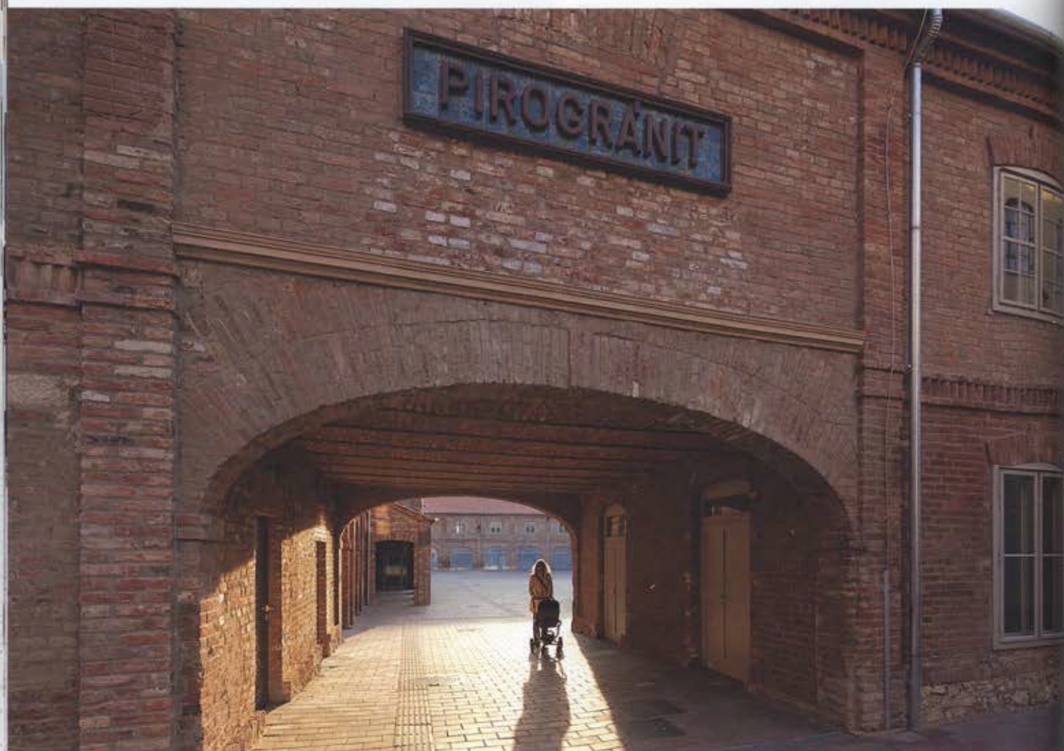
A pirogránit udvar átjárója, E26-27-28, 78-as épületek

Egy megejtően szép, alig féloldalnyi japán népmesében egy kereskedő gyönyörű, régi kannát pillant meg egy fogadóban. Felületén lehetőleg díszítés, indázó cseresznyefa, ágán a fülemüle énekétől megrezdülnek a szirmok. A kereskedő megvásárolja a kannát, ám mikor pár nap múlva visszatér, hogy hazavigye magával, a fogadós egy fényesre tisztogatott edénnyel várja. Buzgalmában azonban észre sem vette, hogy a fülemülét is letakarította. Egy tervezési kérdés metaforikus felveze-