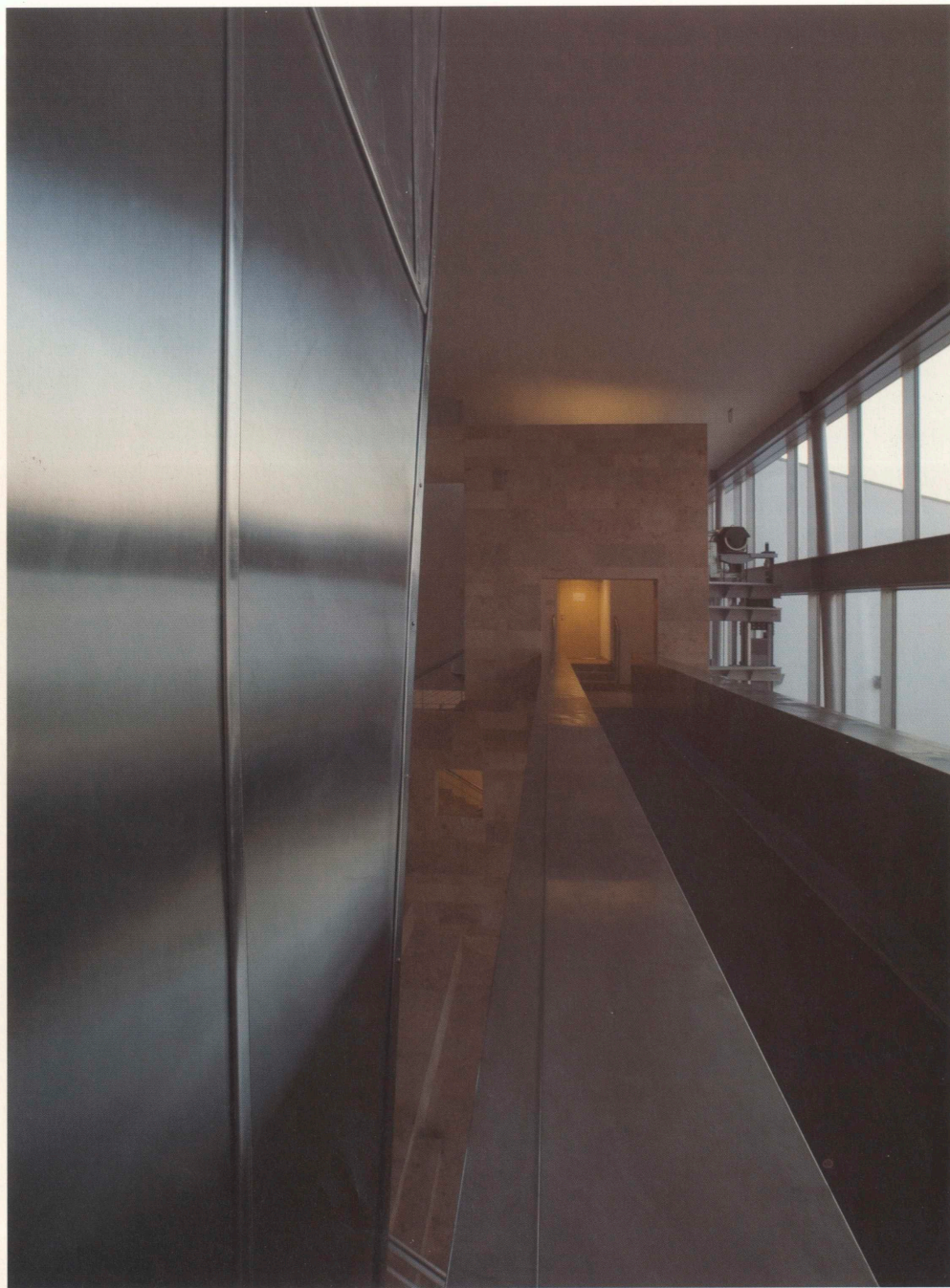
Lift, hid: lehetőségek a tér belakására és remek kilátóhelyek az előcsarnokra, a kapuzatig feszülő területre és a piactérre