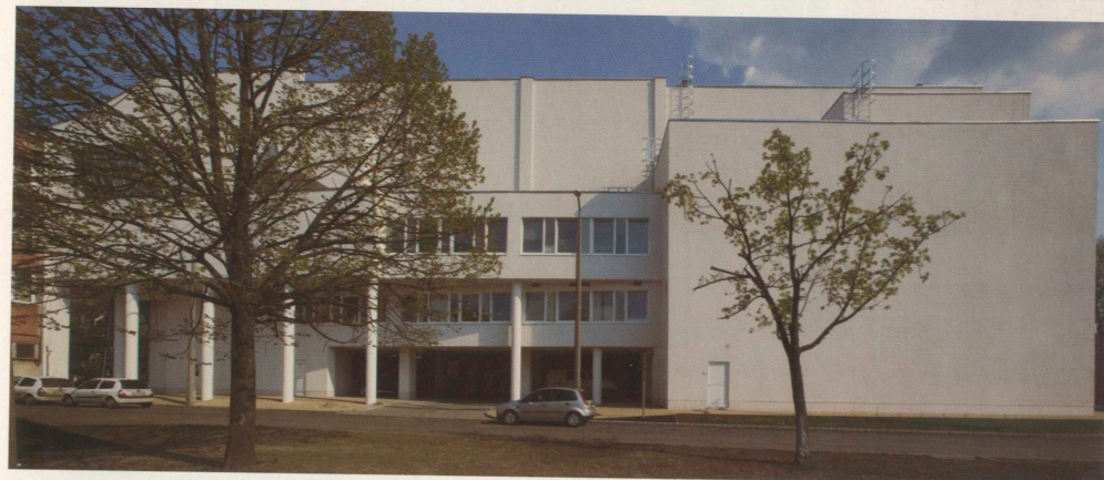
A hagyományostól elütő építész: előretolt kapu, hátravont tömeg, megtört síkok