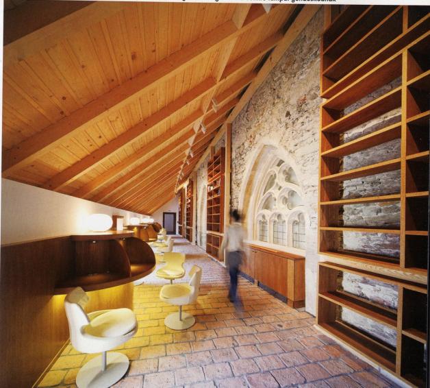
Szinyvtár a templom mellett a tetőtéri kerengőszéren. A megfelelő világításról a Solinfo lámpái gondoskodnak