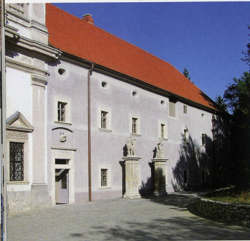
Nincs különbség – az építés logikájának megértése