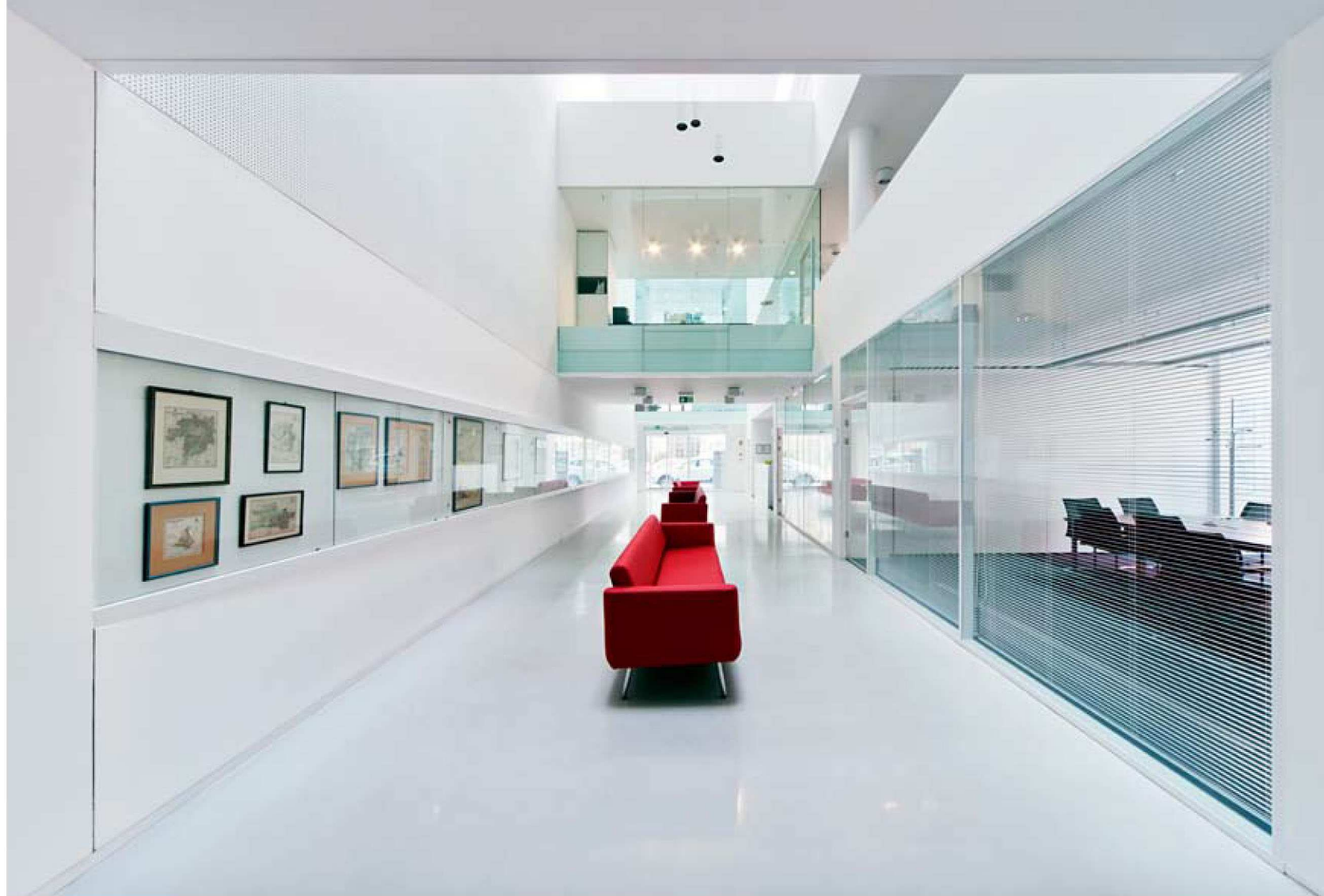
A fogadótér vörös színű bútora egyfajta ellenpontként erősíti a föntről érkező, reflektált fény okozta derengést

megoldás, ahogyan a sakktabla-rendszerbe szervezett, térben plasztikusan formált, ritmikusan süllyedő, emelkedő raszterei úgy dinamizálják a szomszédra néző hosszabb homlokzati szakaszt, mintha apró kis modulatokkal „nyúlna” a ház az üres tér felé. Az utcai homlokzati szakasz és tömbbelseji homlokzatmező tulajdonképpen azt az érzetet kelti, mintha ki-be mozduló, kötésekben álló üveghasábokból szerveződne az épület. Talán nem belemagyarázás, ha ezt a kötésrendet én gesztusként értelmezem, a homlokzati klinkertéglás burkolatok kötésrendjének átírataként. Így ez az üveghasáb-rendszer nem feltétlenül a transzparencia érzetét kelti, hiszen sokkal húsosabb annál, hogy puszta üvegmembránként lássuk. Valódi határoló felületté és szerkezetűvé válik ez a megoldás, testet ad a térnek úgy, hogy a már tárgyalt oldaltetek űrjét szétbontva, kisebb elemekből építi újra.