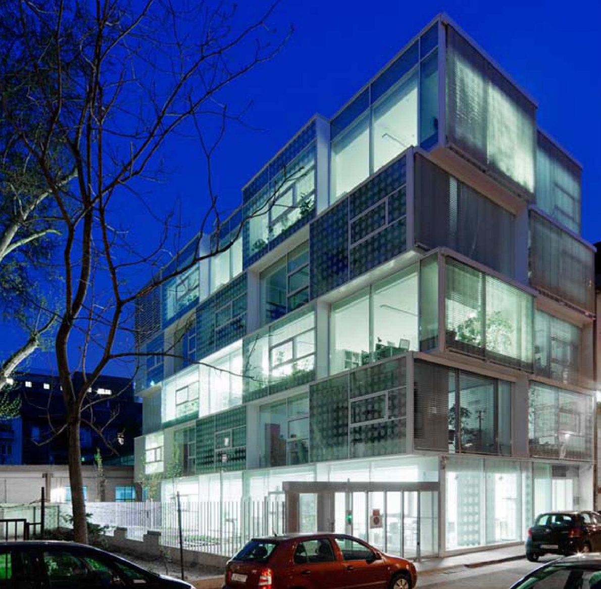
Az épület utcai oldalainak esti látványa, aminek előterében az a bizonyos oldaltelek van

hatást keltenek, ami ebben a metszetben újra kiritkul. Nem lesz teljesen üres az átrium, hiszen egy-egy tárgyaló üvegdoboz színterandom kiosztásba csúszik fokozatosan bele ebbe a térbe is, mégis derengő, derített, reflexes fényvel töltött épületrészben vagyunk, ami metaforikus, elegáns, elemelt, olyan se kint, se bent, se zárt, határolt, se végtelen.