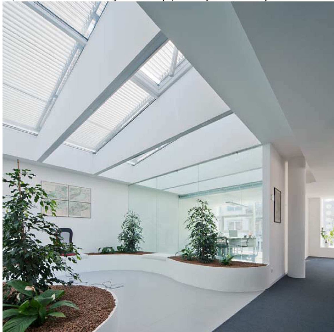
Az épület átszellőztetésében és természetes világításában kulcsszerepet játszó felülvilágító-hasíték, illetve intelligens vezérlésű tetőablakok

Belépve az épületbe az is érthető, hogy ezek a raszterek tulajdonképpen az irodai tereket, az irodákat, munkahelyeket kijelölő raszterek is egyben. Mindazonáltal építészeti értelemben fontosabb, hogy az épület belsejében fehér síkokkal határolt és egy hasítékszerű üveg felülvilágítóval bevilágított átriumba érkezünk. Itt a téri nyitottság, az üresség újabb értelmezésével találkozunk. A külső üveghasábok valahogyan mégis sűrű