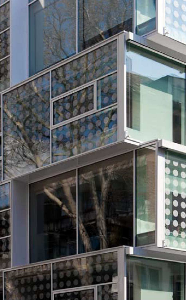
A sajátos kötésrendbe szerkesztett, sakktábla ritmú üvegdobozok szinte „eltüntetik” a transzparencia érzését

Többször írtam, írtunk a Medve – Kacsá – Ganz - Gyorskocsi utcák sajátos téglavilágáról. Most egy olyan Medve utcai irodaházról szólunk, ami látszólag radikális szakítást jelent a téglarchitektúrától. Első látásra – a csodálat és zavar biztos jeleként –, kapaszkodókat keres a szerző. Kiszakítva a téglatipológia komfortzónájából először egy tavalyelőtti emlék ugrik be. Ekkoriban jártam a düsseldorfi Feldmühleplatz-on épült Richard Meier irodaházban, a Grohe központjában. Egy fél napot töltöttem itt, nagyon erős Meier-élmény volt nem tagadom. Nem főmű, de az mégis lenyűgöző, ahogyan Meier költészetbe fordítja a tárgyilagosságot.