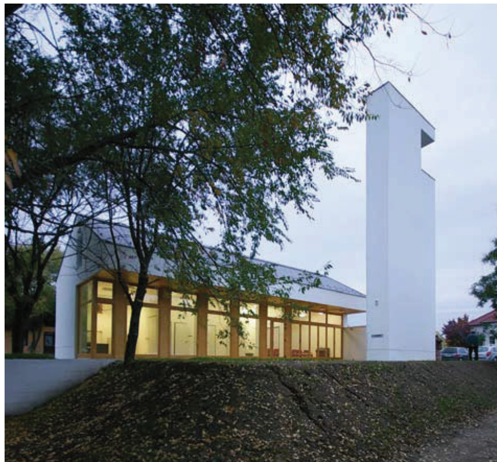
A kívülről zárt tömeg az udvar felé teljesen megnyílik

A főutcáról befordulva azonnal magára vonja tekintetünket a harangtorony erőteljesen redukált, minimalista tömege, amely a református hagyományoknak megfelelően a többi épülettől függetlenül áll. Szigorú funkcionalitás formálta: a szinte térbeliségét vesztő, zárt, tömörnek tűnő hasábjából csupán a majdani harang hasítja ki magának a helyét. Ez a zártság jellemzi az egész együttest az utca felől, sziluettként jelezve a református közösség otthonra találását, és a kortárs építészeti megérkezését.