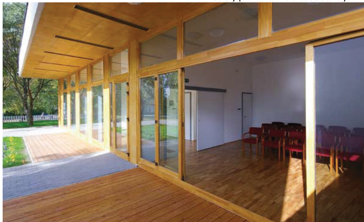
A tető túlnyújtása hasznos átmeneti előteret eredményez

A református közösség új épületegyüttesének már elkészült részei is karakteres, kortárs képet hordoznak, és erős kontrasztot jelentenek a település eddigi építészeti képével szemben, de az említett második ütem megépülte fogja a teljes egységet, az elkészült művet jelenteni.