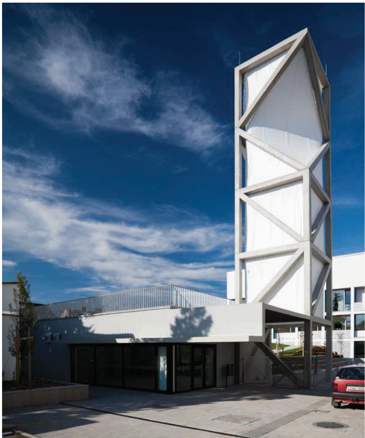
A klímatorony felhívja a figyelmet az új funkció bátor tömbbelsőbe feszülésére, és egyben kellemes mikroklímát alakítva jelképezi a környezettudatos szemléletmódot

A nyugati és déli homlokzati falsíkban megjelenő markáns ablakok maximális felületen keretezik a látványt, kapcsolatot teremtve