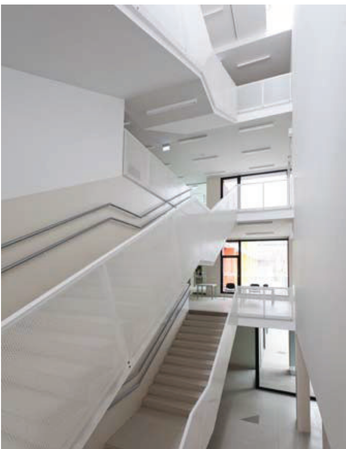
A számos funkció között az Agóra egész területén egyszerű a tájékozódás – ezt segítik a belső tereket is meghatározó homlokzatszínek

szabadtér és fedett épületrészek között: az agóra kivételnek az épületben zajló történések, míg a belső tereket meghatározza a közvetlen környezet látványa. A belső-építészeti elemek a funkciókat szervesen el látva az épület egységes megjelenésébe integráltak, a hely identitását ezek is erősítik.