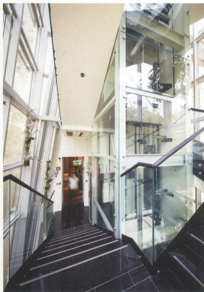
Korszerű vertikális közlekedőrendszert valósítottak meg üveg lépcsőházzal és lifttel

A második terem a buddhizmus szentélye: a különböző ábrázolású szobrok mellett a vallásgyakorlat tárgyait is megismerhetjük: fogadalmi táblák, szertartási edények sorakoznak az üvegtáblák mögött. Ezzel szemben foglal helyet a másik meghatározó világvallásnak szentelt rész: a hinduizmus terme: a kultúrák istenségeinek különböző ábrázolásait