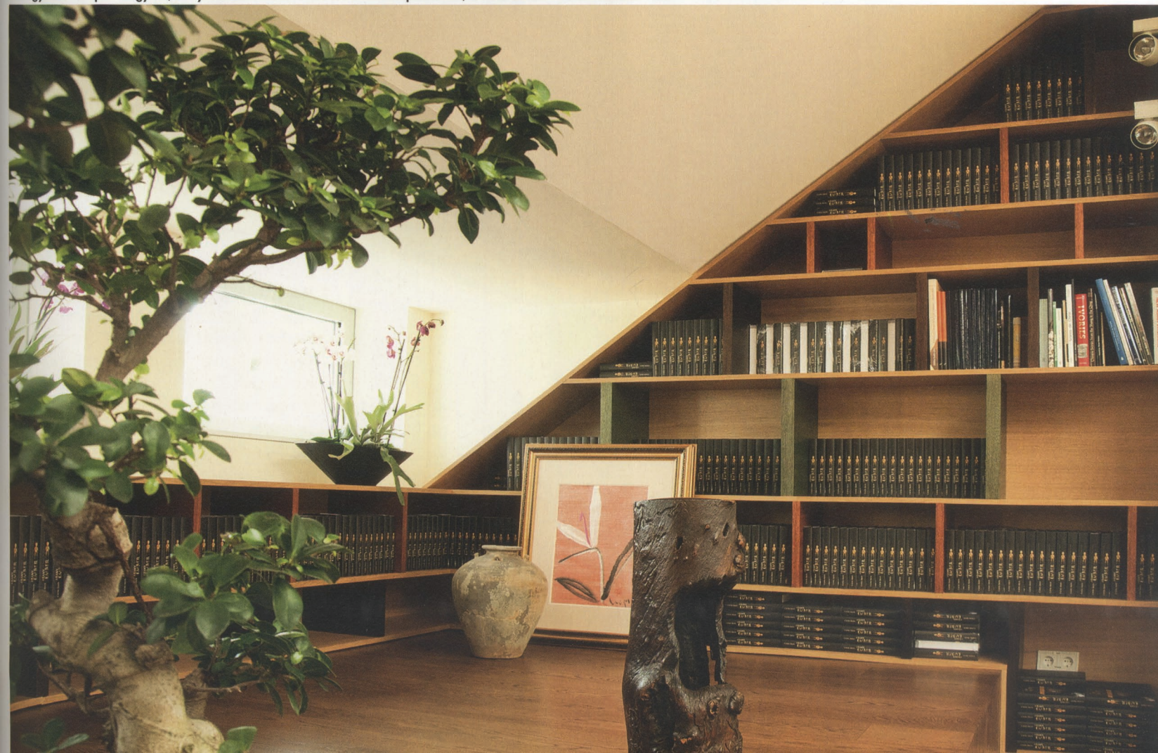
Az ügyesen elrejtett tárgyoló, könyvtár berendezése kedvez a kontemplációnak, a kutatásnak – Fotó: Koleszár Adél