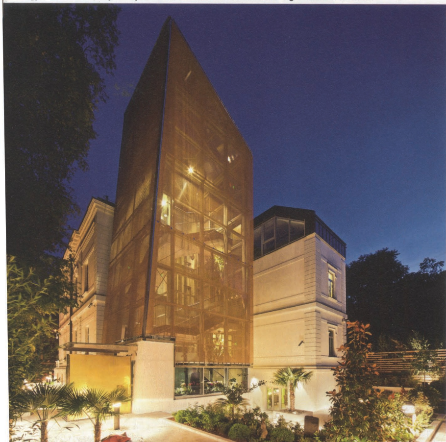
Első látásra ki gondolná, hogy a patinás villa új lakója Európa legrangosabb délkelet-ázsiai gyűjteménye?