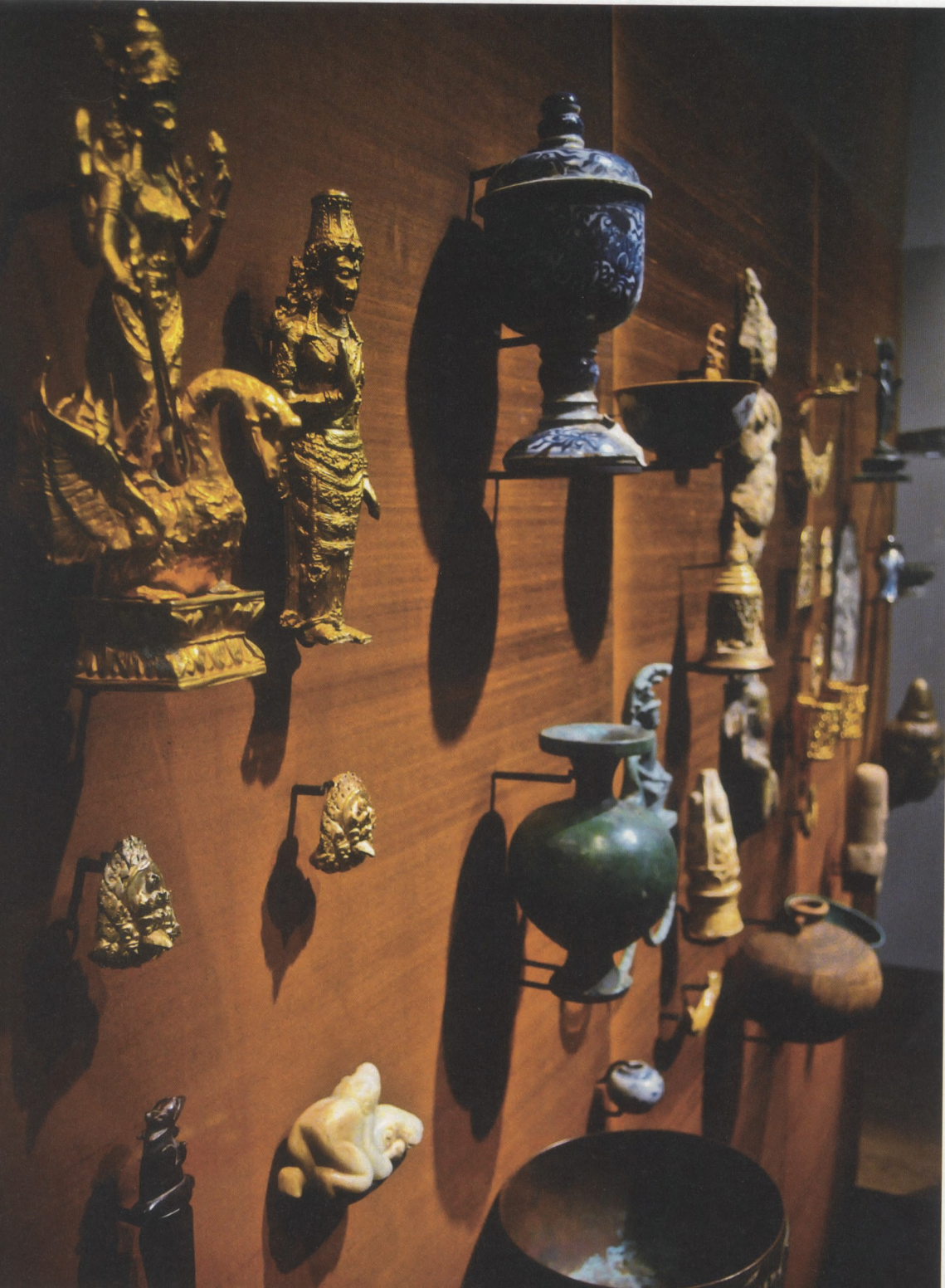
A kollekció számos olyan kincset rejt, amely nemzetközi szempontból is páratlan – Fotó: Tímár Benjámín

A gyűjtemény maga, és az új szemléletű múzeumi program nemcsak bemutatni kíván, hanem képezni és oktadni is. Az a mód, ahogyan komplexen megközelít egy témát, Európán belül is kivételesnek számít. A gyűjtemény ugyanis több nemzetközi tudományos együttműködési és régészeti programba is bekapcsolódott, az Andrássy úton székel például a Magyar Délkelet-ázsiai Kutatóintézet vagy a Magyar Indokínai Társaság is. Nemrég egy kiváló khmer epigráfus és történész hölgy kapott egyéves ösztöndíjat. Az Andrássy úton szerényen megbúvó épület koncepciója, működtetése elüt a magyar átlagtól, szakít a konzervatív múzeumi felfogással és hagyja XIX. századi módon látni és láttatni Délkelet-Ázsia kultúráját. Az Arany múzeum létrehozása csupán ennek a kulturális misszióknak az impozáns kezdete.