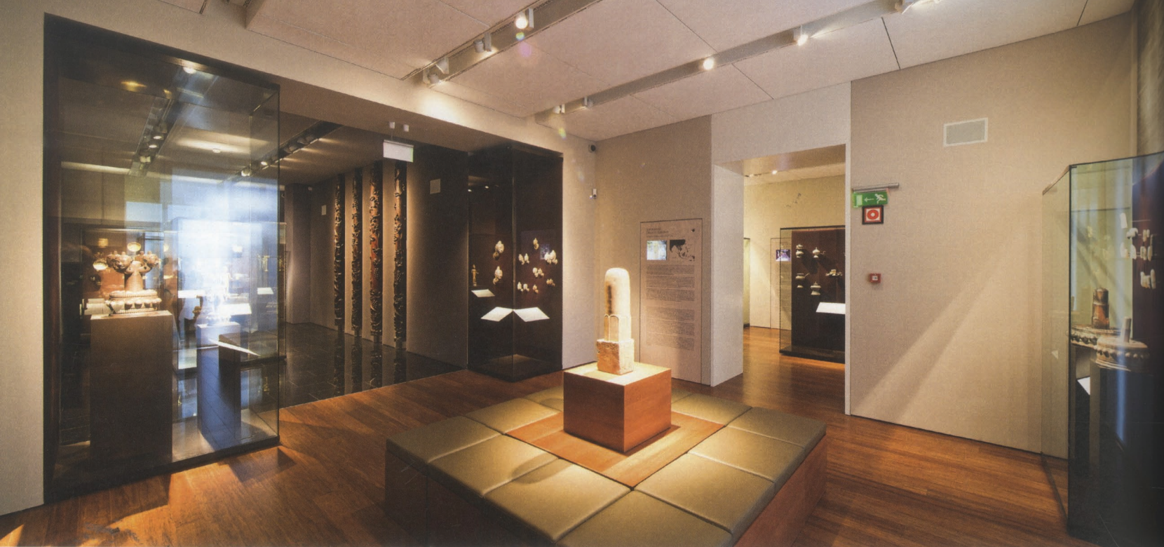
Frappánsan, egy XI. századi lingám köré tervezték a pihenésre alkalmas helyeket, innen körbe lehet tekinteni a részletgazdag kiállítótereket