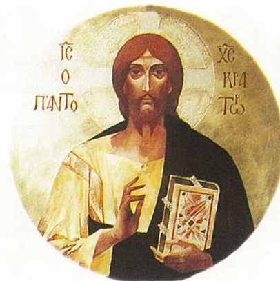
SOMOGYI-SOMA LÁSZLÓ: Pantokrátor (olaj, metall, Ø118 cm). A művész festménye a kupolában kap helyet Balra: Földszinti alaprajz