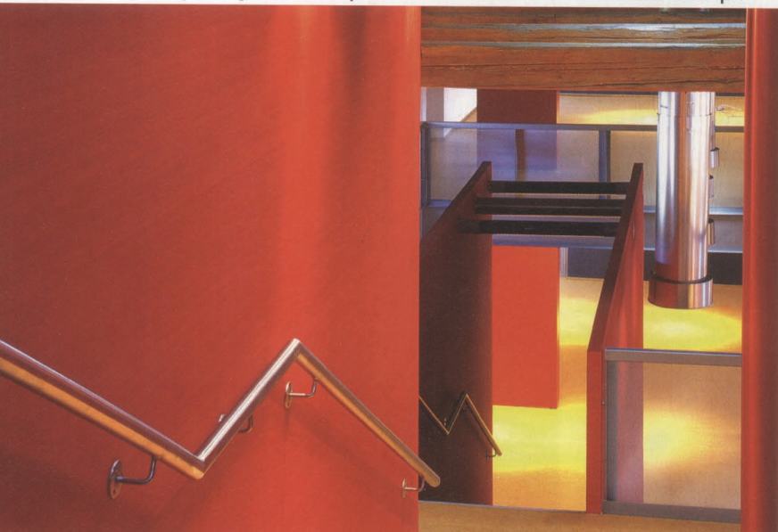
Nagszerűek azok a lépcsőmegoldások, amelyek a különféle szintek közötti közlekedést biztosítják

70-80 000 látogatóra számítunk évente. Célcsoportjaink nagyon szerteágazók, de prioritást élveznek a magyar és külföldi általános és középiskolás diákok, valamint a családok. Mosonmagyaróvár földrajzilag, kereskedelmileg és turisztikailag nagyon jó lehetőségekkel rendelkezik. Egy, a városunk köré rajzolt, 150 km-es sugarú körben három főváros is megtalálható, amiket korszerű autópályák kötnek össze, tehát a lehetőségek adottak, csak ki kell aknázni őket. Kollégáimmal jelen pillanatban is azon munkálkodunk, hogy ezeket az adottságokat maximálisan kihasználjuk. Nem is oly rég kértük fel az ausztriai és a szlovákiai magyar nagykövetet, hogy támogassák a FUTURA-t. Kérésünket örömmel el is fogadták, és biztosítottak bennünket, hogy minden segítséget megadnak az augusztus 17-én nyitó FUTURA Interaktív Természettudományi Éléményközpontnak. (x)