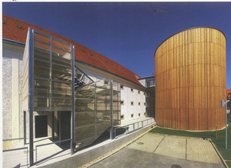
Az egyik silóformába került az auditorium

Mosonmagyaróváron a mosoni belváros egyik jellegzetes, meghatározó épülete az ún. FUTURA. A közel 300 éves, korábbi magtárépület műemléki védettség alatt áll. A város, illetve a Mosoni Polgári Kör több éve gondolkodott az épület olyan hasznosítási lehetőségén, ami egyúttal összhangban van a belváros rehabilitációs elképzeléseivel. Az önkormányzat 2008-ban beadta a mosoni belváros rehabilitációjára elkészített EU-pályázatát, mely az Erzsébet tér, a Kápolna tér, a piac, valamint a Fehér Ló Közösségi Ház megújítását tartalmazta. Az Európai Unió elvárja, hogy a rehabilitációs program keretében olyan funkciók kerüljenek a területre, melyek élettel töltik meg, és biztosítják annak fenntartható fejlődését. Így fogalmazódott meg a gondolat, hogy igény lehetne egy olyan természet-tudományi interaktív bemutatóközpontra (science center), mely a város határain túlmutató érdeklődésre tarthatna számot. Egy ilyen funkció a város idegenforgalmi vonzerejét is jelentősen növelhetné.