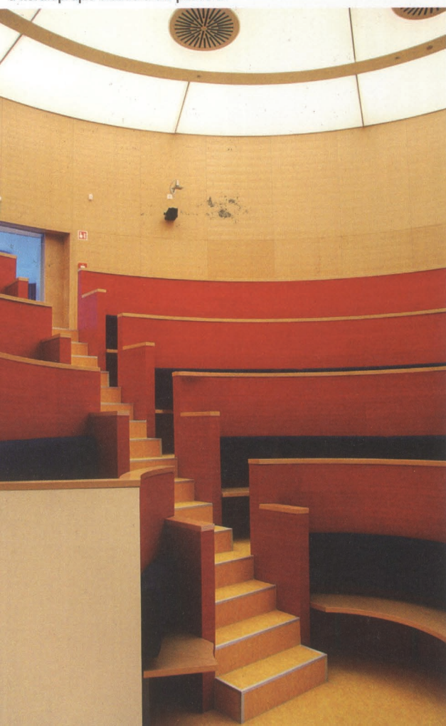
Meredeksége ellenére is tökéletesen funkcionálnak a kör alaprajzú előadóterem padsorai

fém menekítőlépcső szerkezete. Eltérő alapformáik ellenére az épületrészek nem konkurálnak egymással. Dekonstrukció helyett valami éteri harmónia jön létre ebben a kompozícióban. A szép arányok és méretezés erről a kölcsönös tiszteletről szól. Szinte nem is beszélhetünk immár bővítmenyről, régi és új viszonyáról. A faborítású, ablaktalan faforma ugyanabból az ősi, archaikus tudásból fakad, mint a kétszázhatvan éves magtár. A múlt folytatható.