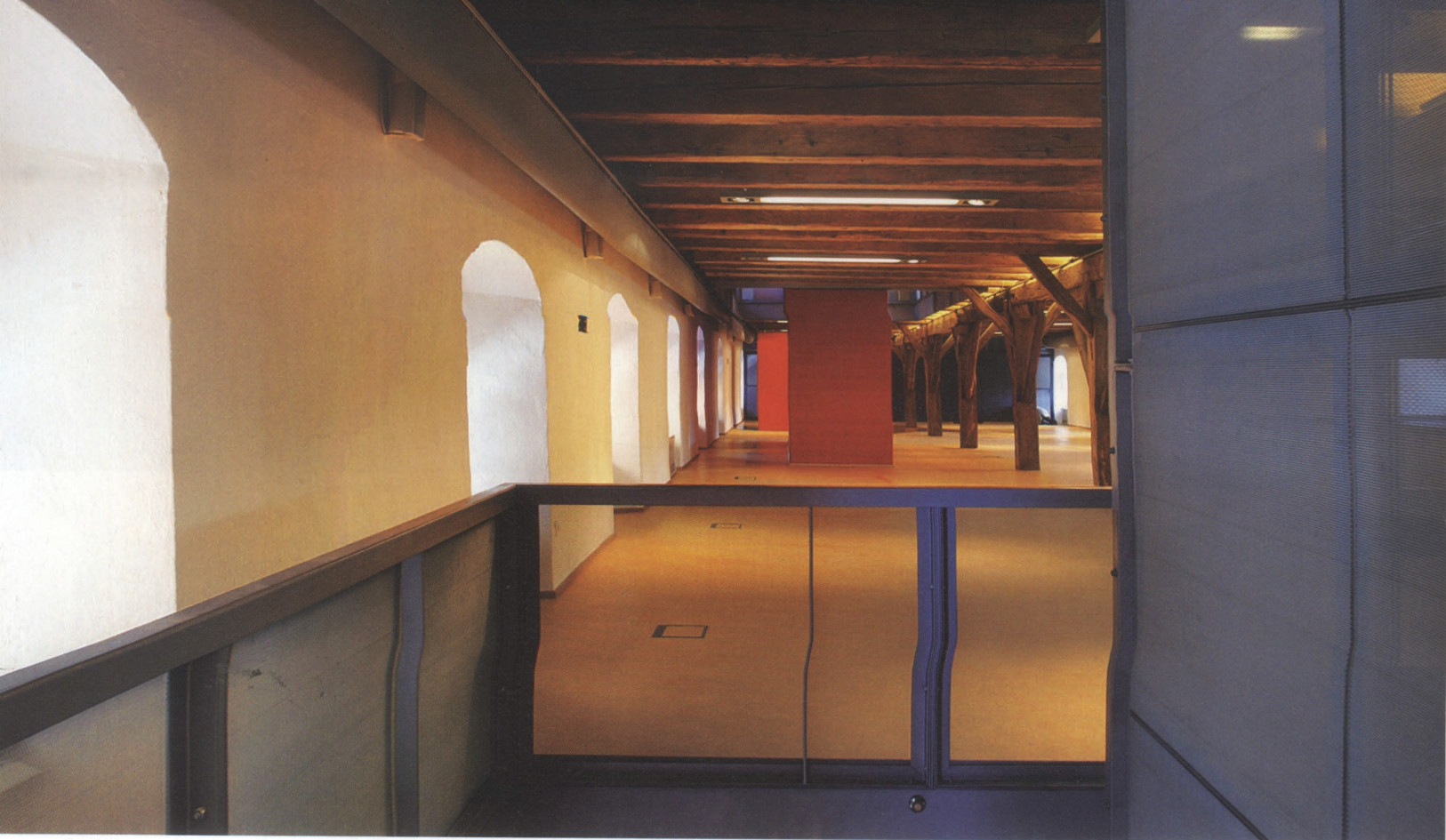
Az eredeti belső tér szükségessége ellenére jut bőven hely a különféle installációk, szemléltetőeszközök berendezésére