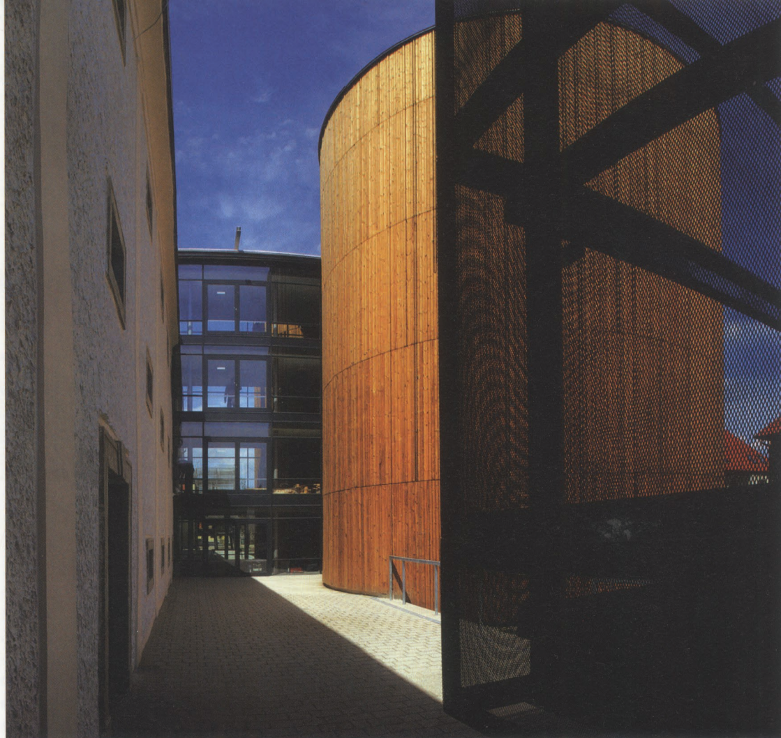
Acél-üveg nyaktaggal kapcsolódik a két silóforma épületrész a főtömeghez