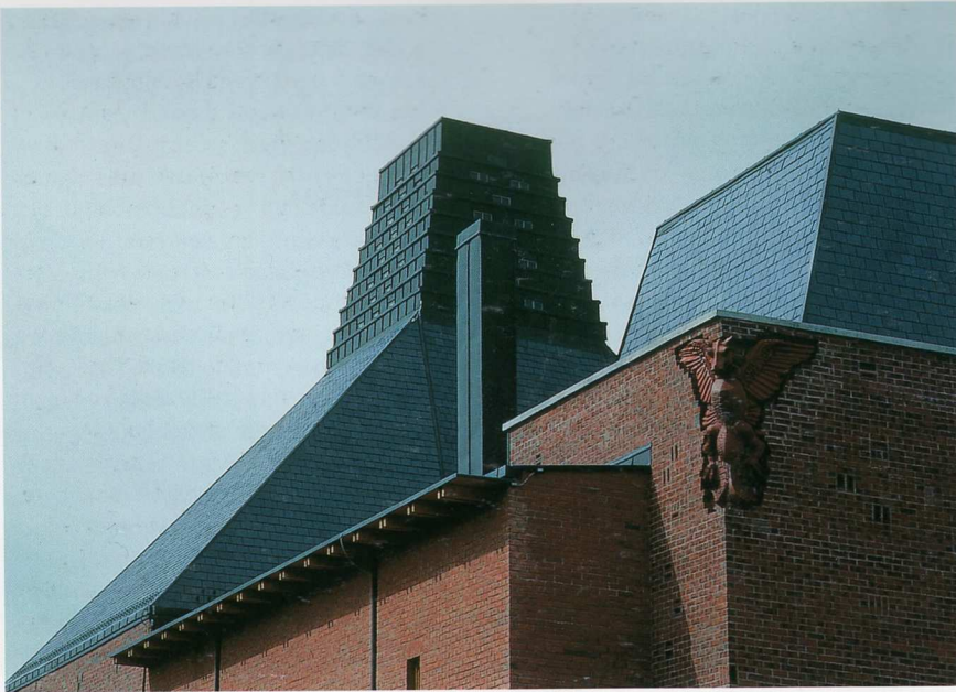
TURÁNYI, Gábor Porcelánium 1999, Herend Ungheria / Hungary

metszet rejlik. Eltér, hogy a három fő funkcionális egységet (előadóterem és könyvtár, irodák, vendégszobák) a tervező lineárisan sorolva helyezte el: a tengelyt a hasadékszerű bejáratához vezető fahíd jelöli ki, ez folytatódik a tornáccal felnyitott előtérben, az egyesületi szárny üvegfallal határolt előcsarnokában, majd az irodaszárny középfolyosójában. Ezt az épületet fegyelmesebb geometria, homogénebb anyaghatás (szárazon rakott andezit és gyöngykavics felületű beton) és finomabb részletképzés jellemzi; ezért kevésbé tűnik romantikusnak. A homlokzatok arányrendszerre és az északnyugati üvegfal farácsának ritmusa szinte zenei harmóniakat idéz. Ezen belül is különleges az utóbbi megfogalmazása: a négyféle lamellás fakeret váltakozása a repetitív zené vagy az afrikai népzene ritmusképletét követi. Van ebben a mindenestől mai megoldásban valami archaikus: a közel-keleti és észak-afrikai országok iszlám építészetének csipkés rácsozatú zárterkélyeire emlékeztet. Ezt az erőteljes motívumot gyengíti néhány tisztán dekoratív elem, így a farácsok fölötti sáv „fótt” mintás deszkaburkolása az északnyugati oldalon.