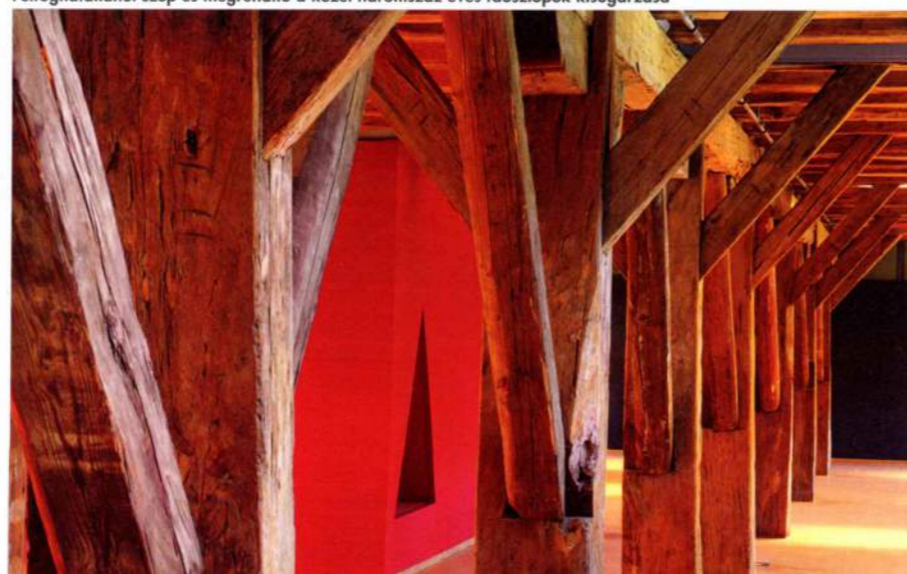
Felfoghatatlanul szép és megrendítő a közel háromszáz éves faoszlopok kisugárzása