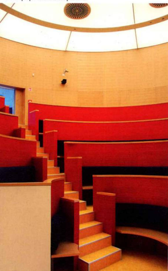
Meredeksége ellenére is tökéletesen funkcionálnak a kör alaprajzú előadóterem padsorai

Némileg leegyszerűsítve tehát: szerelvény-ként kell felfogni mindent, ami az eredetire rá- vagy hozzáépült. Olyan logika mentén értelmezni, amiben az alkotórészek nem akarnak mindenáron szervesülni, szolgáljanak illusztrálni. A vízköddel oltó rendszernek hála, sikerült szinte tökéletes teljességében megtartani az eredeti fa tartószerkezetet, ezért reálisnak látszott az az ambíció, hogy a bekerülő gépészeti elemek, illetve az emeleteket átnyitó közlekedők sem zilálják szét a belső téri rendet. Sőt a megnyitások direkt módon láttatják a több szintet behálózó, rúd-elemek ismétlődéséből összeálló, burcsel-lás fedélszékekkel záródó térrendszer tektonikáját. Így az emeletek átmetsző egykori garatok mintájára beépített fénycsatornák, a megújuló energiát használó gépészet lég-csatornái, a sprinklerök ösztönös, az illeszkedés és a rejtőzködés kényszere nélkül jelen-