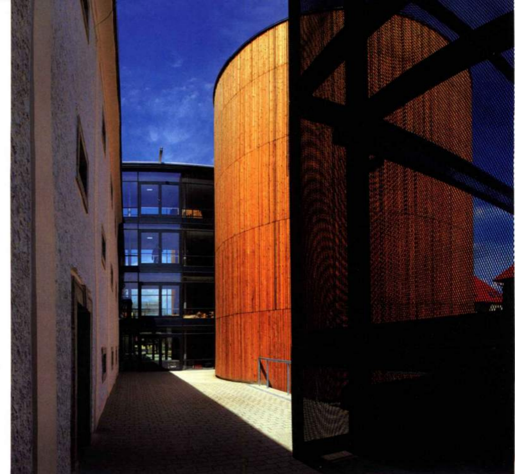
Acél-üveg nyaktaggal kapcsolódik a két silóforma épületrész a főtárhoz